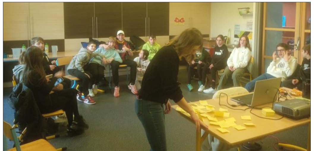
Les réflexions des ados, recueillies sur des papiers, ont servi de base aux discussions.

L'accueil périscolaire de Courcelles-Chaussy a accueilli l'association Couleurs Gaies. La rencontre avait pour objectif d'aborder avec les jeunes du club ados les thématiques du sexisme et de l'homophobie. Pendant deux heures, quator-